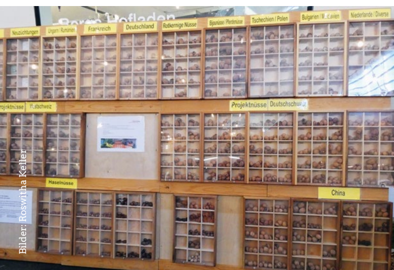
Baumnußinventar von Fructus

Bei der grossartig präsentierten Nussammlung von Fructus konnte man 300 Baumnüsse, Haselnüsse und Kastanien mit Namen und Herkunft bestaunen. Unentwegt knackten die beiden Fachleute am Stand verschiedene Baumnüsse und sieben Sorten Haselnüsse zum Degustieren auf. Häufig hörte ich, dass man sich künftig unbedingt um die „Folgen“ der Vielfalt kümmern sollte: nämlich gute Sorten in den (Hof-) Handel zu bringen, andere besser zu erforschen und neue Ideen zur Vermarktung der Ernte zu finden.