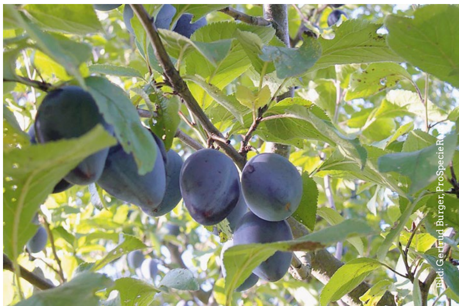
Die Hauszwetschge: anpassungsfähig in Bezug auf Boden und Klima

Der Wuchs des Baumes ist nur in seiner Jugend stark, später mässiger. Im