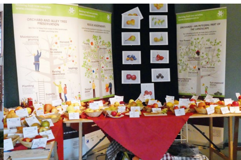
Infostand der Delegation aus Tschechien